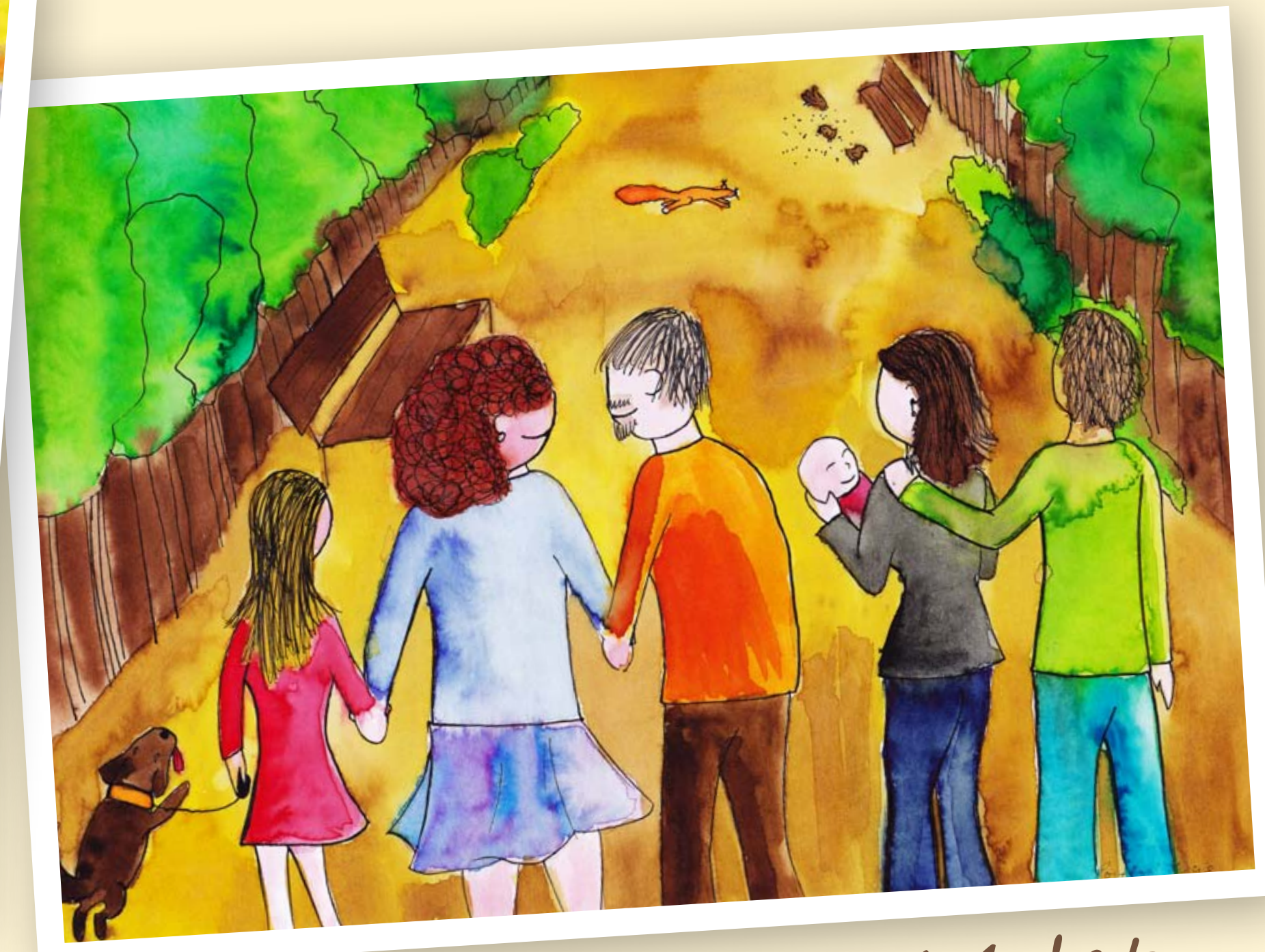
Lucie, 14 let