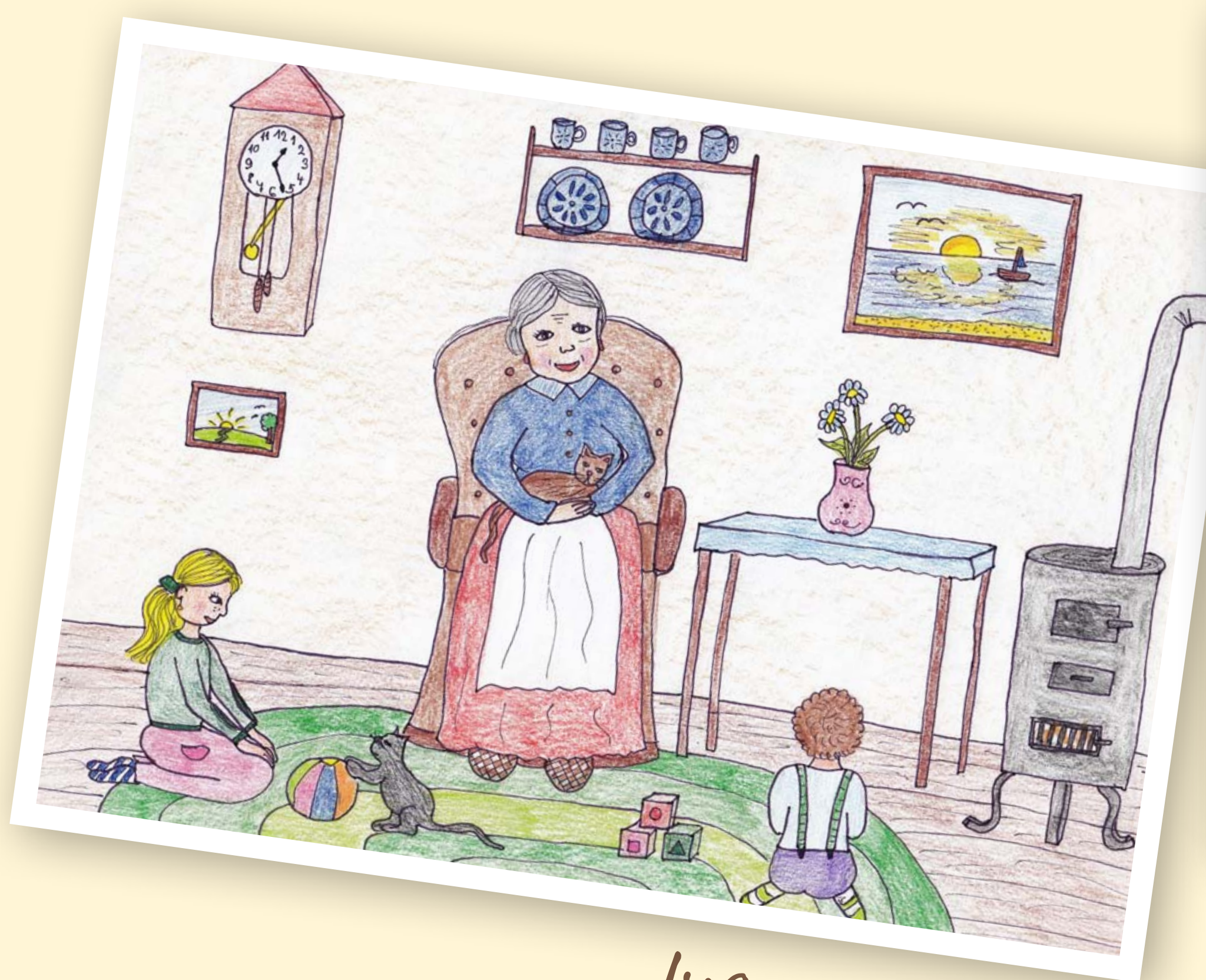
Ivana, 13 let