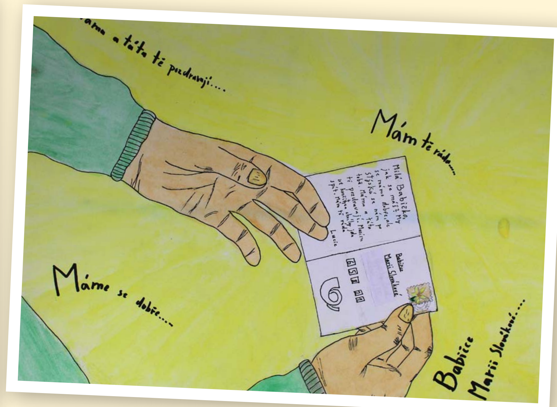
Magdaléna, 12 let