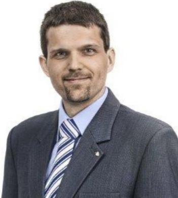
Mgr. Petr Hladík 1.náměstek primátora statutárního města Brna

Motto pro letošní rok je „Hledáme své kořeny…“ a já bych Vás rád pozval: navštivte své blízké a pohovořte si navzájem, zastavte se na chvíli v této uspěchané době a třeba objevíte kousek vzácné rodinné historie, o kterém jste dosud nevěděli.